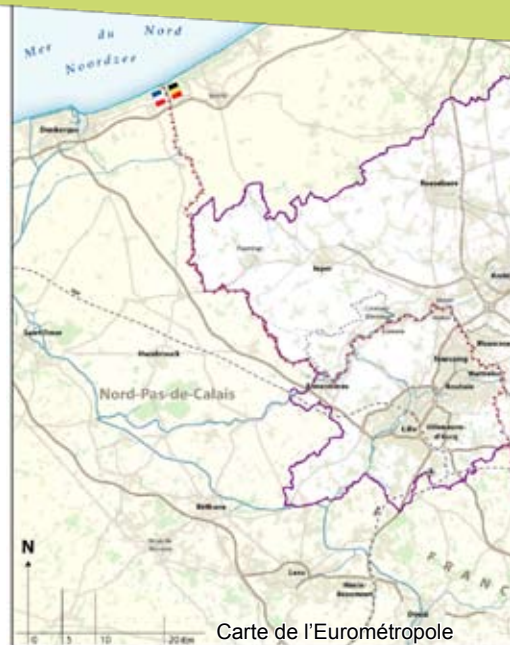
Carte de l'Eurométropole

J'espère que les structures représentant la société civile des trois territoires, Transforum, le Conseil de développement de Wallonie picarde et le Conseil de développement de Lille métropole, seront capables de mettre en place une collaboration transfrontalière, en prenant des positions communes sur des dossiers et des projets qui les concernent. C'est d'une grande importance pour le développement des trois régions ! »